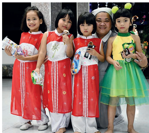
Zr. Jacinta met enkele kinderen tijdens een dansvoorstelling.

Op 19 februari 2023 zeiden we goodbye aan de zusters van Long Thanh en Saigon, die afscheid kwamen nemen. Het afscheid was wat triest, maar wij waren gelukkig dat wij nu namen konden plakken op de gezichten, die we eerder slechts kenden van foto's.