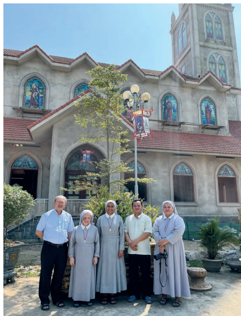
Voor een kerk in Kontum.

Hier ontmoetten wij zovele religieuze zusters en novicen, samen ongeveer 120. Deze zusters hebben verschillende missieposten in de regio. We bezochten hun weeshuis terwijl de meeste