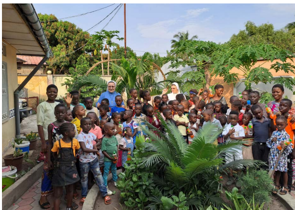
Tijdens het kindermissiefest in 2023

Een grote vreugde voor ons is ook het enthousiasme van de meisjes die Christus willen volgen in het godgewijde leven. Momenteel hebben we in onze gemeenschap in Maluku 2 postulanten en 5 kandidaten die naar een school voor