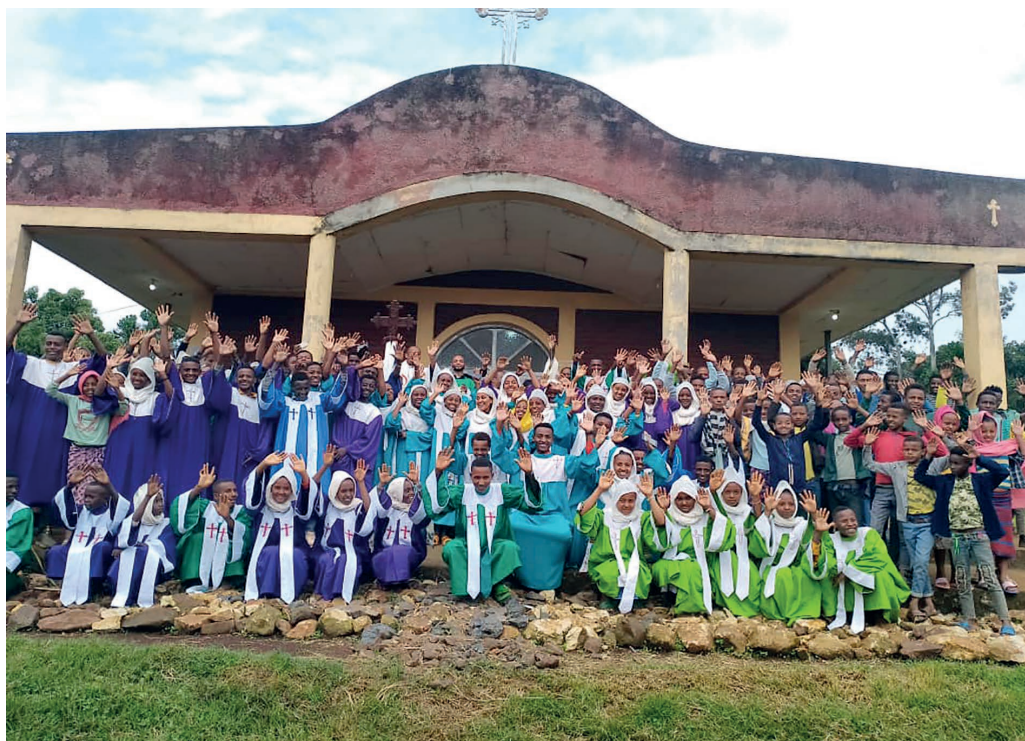
Vorming is belangrijk – Missie in Ethiopië.

Broederlijke groeten van de Congregatie van de Missie Paters Lazaristen, Provincie Ethiopië. Allereerst wil ik u hartelijk danken voor uw financiële steun aan het project; Vorming van de Catechisten en de Jeugd. Dit is inderdaad een grote motivatie en morele aanmoediging om onze missie in verschillende hoeken van dit noodlijdende land te versterken en uit te breiden. Gebaseerd op onze eerdere overeenkomst, voeg ik nu het verhalende en financiële verslag van het project bij, samen met enkele foto's van de uitgevoerde projectactiviteiten. Ik hoop dat de informatie in het verslag aan uw verwachtingen voldoet en ik verzoek u contact met ons op te nemen voor verdere informatie of do-