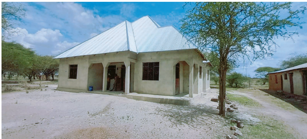
Het bijna klare parochiehuis in Tabora.