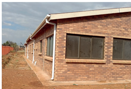
Het nieuwe kloostergebouw in Lesotho.