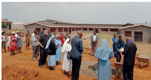
Eerste steenlegging van ons klooster.