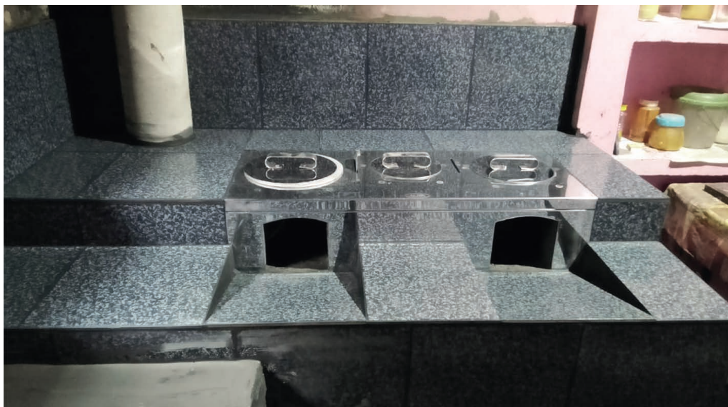
Een kachel zonder rook.